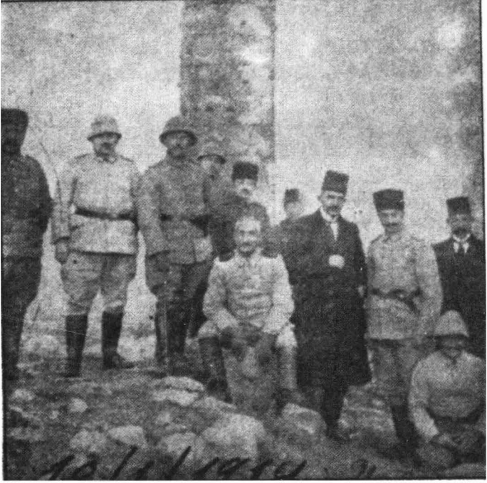
Nusret Bey, 6. Ordu Kumandanı Ali İhsan Paşa (Sabis) ve maiyeti ile Urfa Kalesi'nde