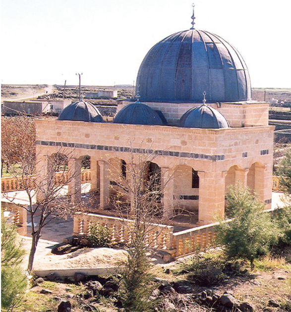
HZ. EYYUB TÜRBESİ