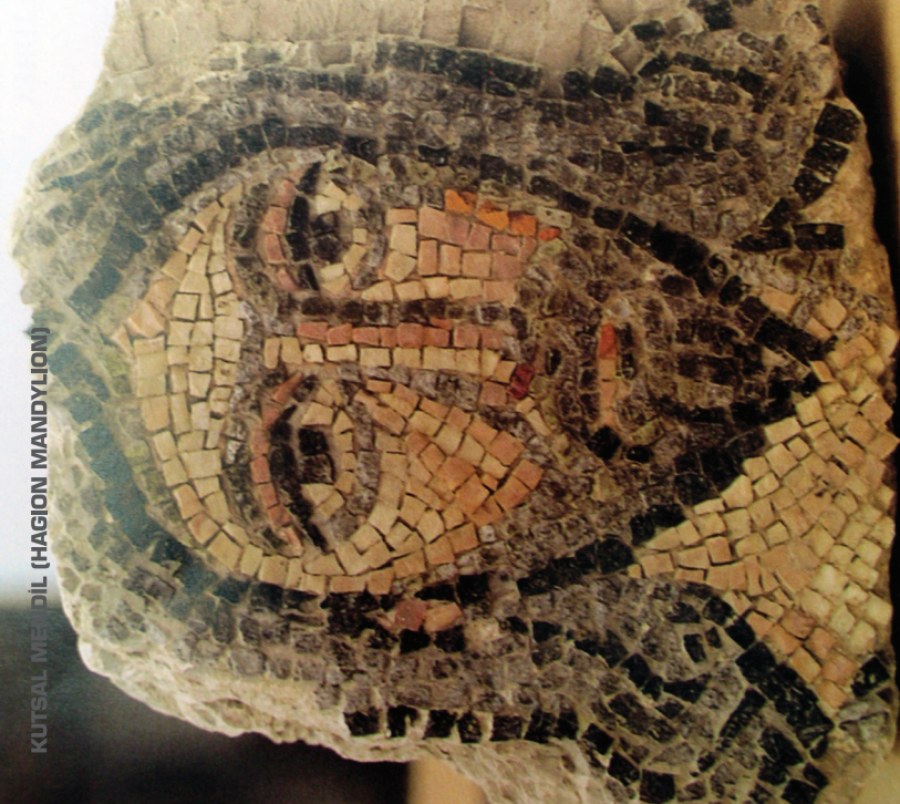
KUTSAL MENDIL (HAGION MANDYLION)

+ΜΑΚΑΡΙΟΙΣ ΕΓΓΥΡΕΚΑΙ Η ΕΣΑΜΑΚΑΡΙΟΣ ΕΙΟΠΕ ΠΙΣΤΕΥΣΑC ΔΕ ΤΟΙΝΑC ΟΙC ΕΤΑΙC ΟΙΔΑΤΑΝ ΤΟC ΠΡΟC ΕΔΕΟΝ ΕCΤΙ ΔΙΟΝ ΤΕCΤΑΝ ΗΝ ΠΛΗΡΩC ΔΙΔΑΞΑΝ ΗΦΘΗΝ ΔΙΜΕ ΔΙΤΟC ΕΛΛΩΔΕC ΟΙΕΝ ΑΤΩΝ ΜΑ ΟΝ ΤΟΝ ΚΑΙ ΒΩΜΑΝ ΟCΤΙC ΚΑΙ ΤΟ ΗΝ ΔΙΩΝ ΗΟΝ ΚΑΙ ΕΙΡΗ ΗΝC ΟΙ ΠΑ ΤΗ ΠΟΛΕΙC ΟΝ ΤΟΙ ΗC ΕΙΤΟΙΚΑΝ ΟΝ ΤΙC ΔΥCΑΙ ΔΑΥΤΗ ΗC ΟCΤΙC CΥΝ ΤΕΛΕΙ ΚΑΝ ΗΜΩΝ ΗC ΔΥ