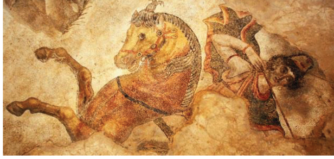
Savaşçı Amazon Kraliçesi Penthesilea