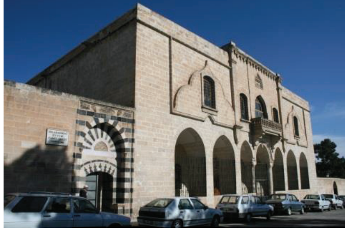
Selahaddin Eyyubi Camii

Yapı üzerindeki pencerelerin kenarlarında kiliseden kalan yarım sütunlar ve birbirlerine dolanmış ejder kabartmaları bulunmaktadır. İlk kilisenin Selahaddin Eyyubi tarafından bir dönem cami olarak kullanılmasından dolayı yapı camiye dönüştürüldüğünde aynı isimle anılmıştır. Cami, 2010-2011 yılında, Vakıflar Genel Müdürlüğü tarafından onarılmıştır.