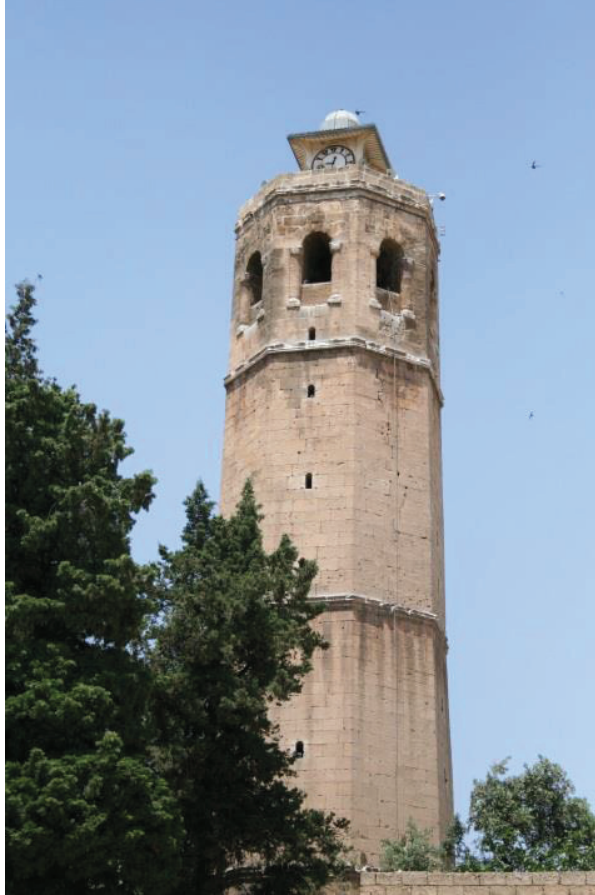
Ulu Camii saat kulesi