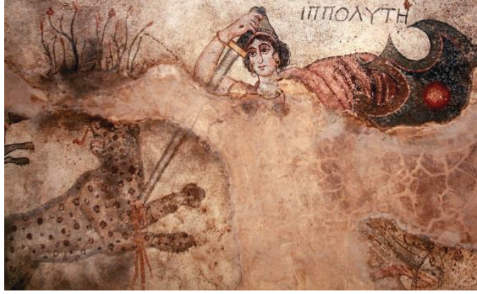
Savaşçı Amazon Kraliçesi Hippolyte

Halepli Bahçe’de Şanlıurfa Valiliği imkânlarıyla Şanlıurfa Arkeoloji Müzesi Başkanlığında ve arkeologlarımızın nezaretinde, ilk etapta 100 m 2 ’lik mozaik gün ışığına çıkarılmıştır. Av sahnesi mozağının kenar bordürlerinde, geometrik motifler, bitki desenleri, güvercin, kanatsız eros, sincap, ördek, keklik, ceylan ve tazi figürlerine yer verilmiştir. Mozaği çevreleyen bordürün köşelerinde ise “Edessa Güzeli” diye kamuoyuna yansıyan, mask dışında, ana sahnede dört amazon kraliçesi Hippolyte (Hiplüte), Antiope, Melanipe (Melanipe) ve Penthesileia (Pentesileya) savaşçı amazon kadınlara özgü giysileriyle, tek göğüslü olarak at üstündeki av sahneleri tasvir edilip Grekçe isimlerine yer verilmiştir.