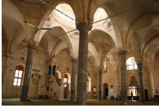
Fırfırlı Camii İten Grnm