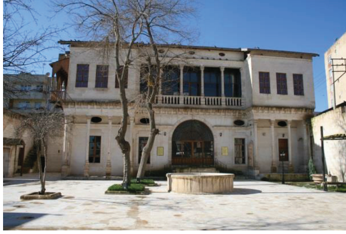
Mahmud Nedim Konağı

Eski Devlet Hastanesi yakınındadır. 1903 tarihinde inşa edilmiştir. Avrupai tarzda konak mimarisi ile geleneksel tarzda Urfa evi mimarisinin kaynaştığı bir özelliğe sahip olan ve oldukça geniş bir alana yayılan konak, haremlik ve selamlık bölümlerinden meydana gelmiştir. 1940'lı yıllarda Halk Tiyatrosu bu binada gösteriler yapmıştır. Konak, Şanlıurfa Valiliği tarafından onarılmış ve 11 Nisan 2009'da " Şanlıurfa Kurtuluş Müzesi " olarak hizmete sunulmuştur. Ayrıca Konağın bir bölümü, Devlet Türk Halk Müziği Korosu'na tahsis edilmiştir.