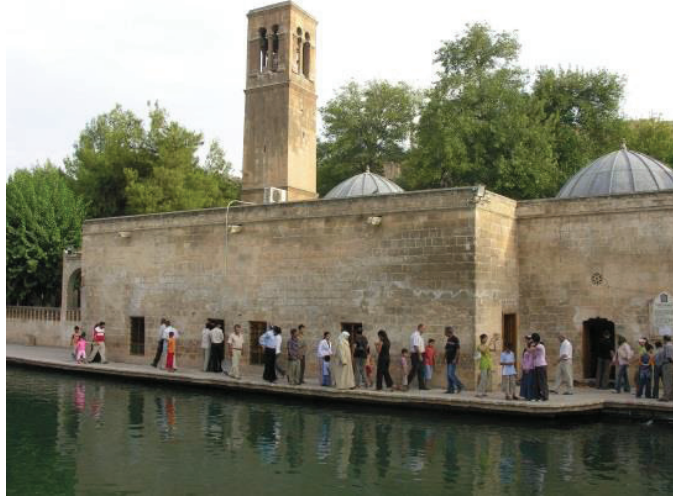
Halil-ür Rahman Camii (Döşeme Camii)