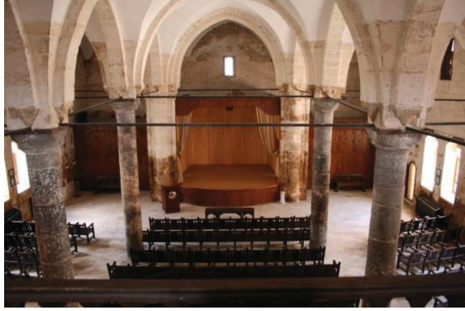
Reji Kilisesi İçi