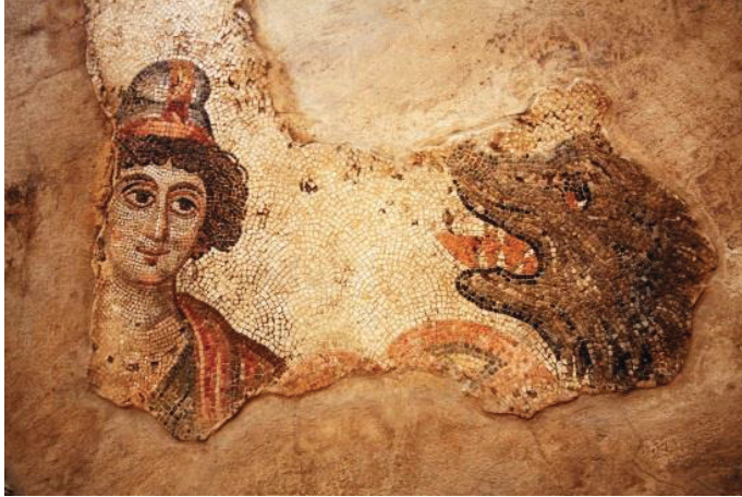
Savaşçı Amazon Kraliçesi Antiope