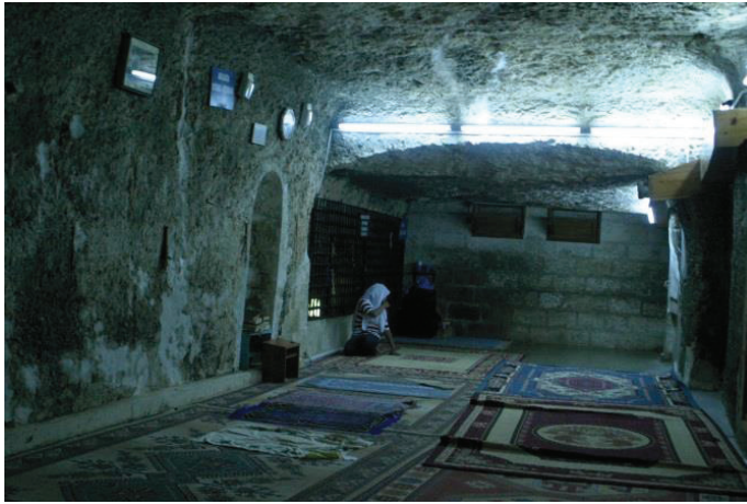
Mevlid-i Halil Mağarası

Mevlid-i Halil Camii, Dergâh Platosu içerisinde, Balıklıgöl civarında yer alır. Mevlid, “kutlu doğum” demektir. Hz. İbrahim Peygamberin yanı başındaki mağarada doğduğuna inanıldığından, camiye Mevlid-i Halil Camii adı verilmiştir. Mevcut kaynaklara göre yapı beş büyük evre geçirmiştir. İlk olarak Seleukoslar döneminde alana, bir putperest tapınağı yapılıır. Yahudilik döneminde aynı alanda bir havranın varlığından bahsedilir. Hıristiyanlığın ilk dönemlerinde, M.S.150 yılında, aynı alana Hıristiyanlar Kilisesi adında bir kilise inşa edilir. Bizans döneminde bu alana Urfa Ayasofyası yapılıır. Son olarak; Osmanlı döneminde 1523 tarihinde Muhammed Salih Paşa tarafından aynı alana cami inşa edilmiştir. Halk tarafından Mevlid-i Halil Mağarasından çıkan suyun zemmenden sonra en şifalı su olduğu kabul edilmektedir.