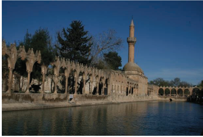
Halil-ür Rahman Gölü (Balıklıgöl)

Urfa Kalesi'nin kuzeyinde bulunan Halil-ür Rahman Gölü((Balıklıgöl) Hz. İbrahim için “ateşin serin ve selamet olduğu” mekândır. Kutsal kitaplara göre; M.Ö. 2.000 yıllarında Urfa'da yaşayan Nemrud Bin Ken'an'ın ilahlığını reddeden ve akıl yoluyla Rabbini bulan ilk insan Hz. İbrahim, Nemrud ve ahalsinin tapındığı putları kırınca ateşe atılmasına karar verilmiş, Mucize-i İbrahim bu mekânda gerçekleşmiş ve mekân gül bahçesine dönüşmüştür. Bu inanış semavi dinlerce ve nesilden nesile aktarılan halk hafızasındaki bilgilerce de kabul edilmektedir.